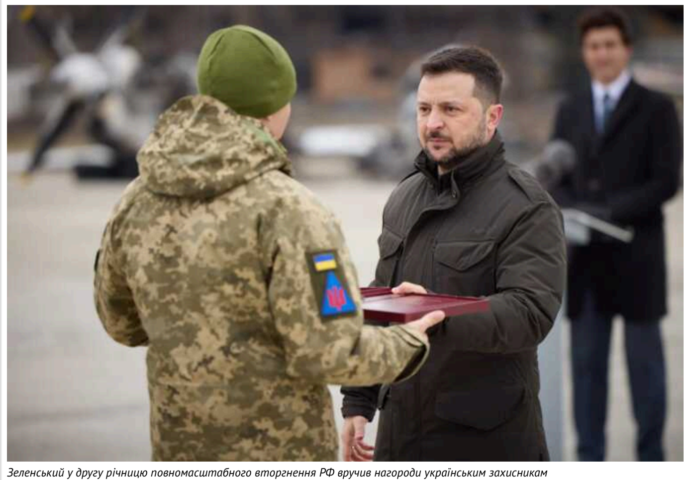
Зеленський у другу річницю повномасштабного вторгнення РФ вручив нагороди українським захисникам

На церемонії до другої річниці початку повномасштабного вторгнення Росії президент України вручив високі державні нагороди українським воїнам, які сприяють виходу країни з війни. У присутності високих гостей із західних країн-партнерів нашої держави президент України відзначив захисників, які проявили особисту мужність і героїзм, захищаючи рідну землю.