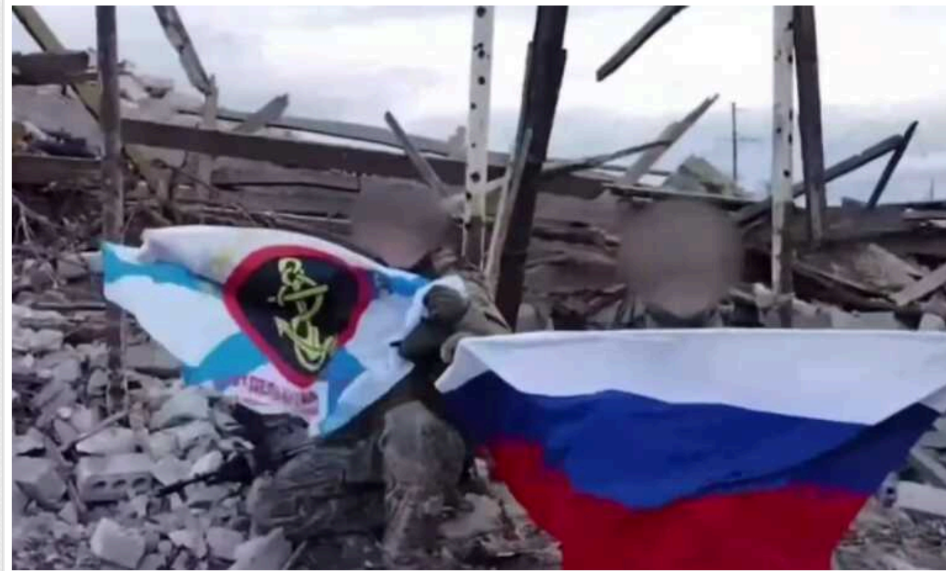
ЗСУ знищили групу окупантів, які встановили у Кринках прапор РФ.

Українські військові знищили групу росіян із 810-ї бригади, які встановили у Кринках на лівобережжі Херсонщини прапор РФ.