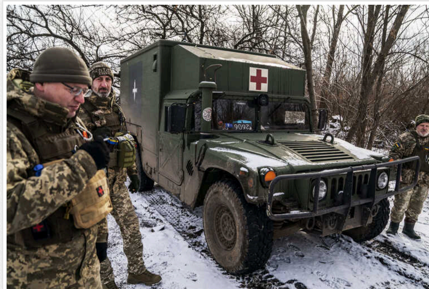
ЗСУ вийшли з села Ласточкине на Авдіївському напрямку, щоб уникнути перекриття логістичних шляхів та для збереження особового складу, – військові