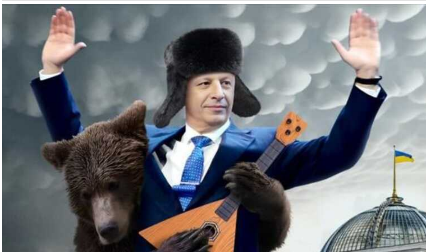
Друга річниця повномасштабного вторгнення росіян і ждуни “руського міра” у Верховній Раді

У другу річницю повномасштабного вторгнення Росії в Україну у Верховній Раді залишається чимало нардепів, які десятиліттями були представниками інтересів Кремля і далі публічно поширюють наративи російської пропаганди.