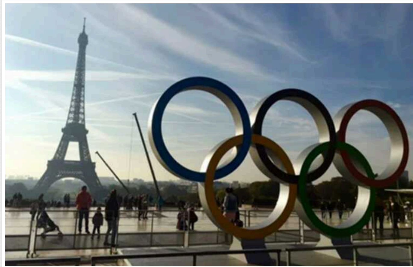
РФ відмовилася від участі в Олімпіаді-2024 і почала погрожувати "нейтральним" спортсменам кримінальними справами

Олімпійський комітет Росії (ОКР) нагадав спортсменам, які погодяться виступати на Іграх-2024 у Парижі під нейтральним прапором, про те, що це може призвести до "порушення російського законодавства". В організації таким чином оцінили умови допуску представників РФ до змагань у столиці Франції.