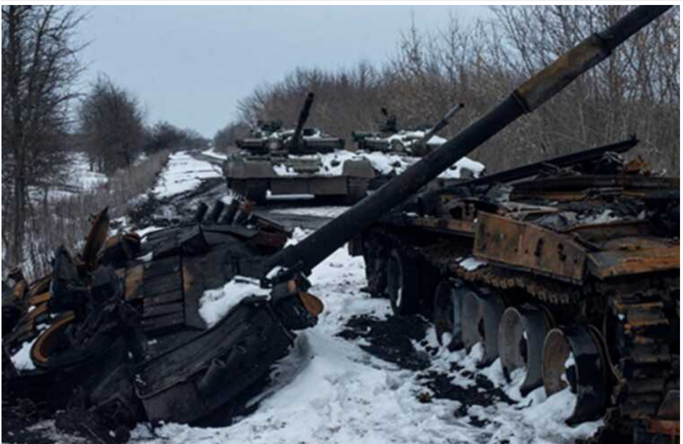
Втрати армії РФ за два роки війни проти України стали абсолютним рекордом, – Коваленко

Вторгнення російської армії в Україну стало найпровальнішою та найганебнішою кампанією для Росії за весь час її існування. Втрати ж окупаційних військ уже вважаються наймасштабнішими не лише в історії РФ, а й СРСР після Другої світової війни. Причому унікальність у тому, що у певні місяці армія Росії втрачала стільки особового складу чи танків, скільки не налічується навіть у деяких арміях країн НАТО.