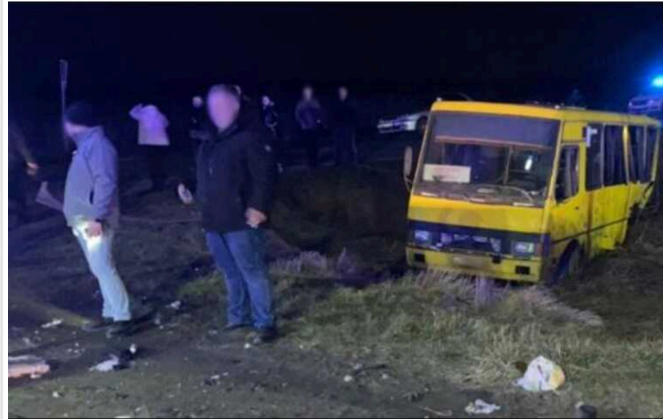
Жахлива ДТП у Львівській області: дві пасажирки випали з автобуса та потрапили під фуру

Моторошна аварія сталася ввечері 23 лютого на трасі Київ–Чоп у межах села Старий Ярчів Львівського району.