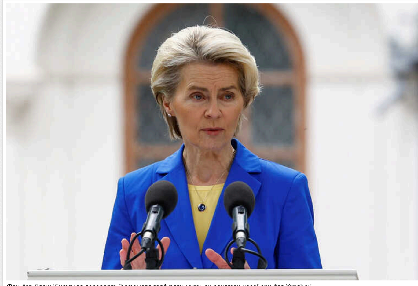
Фон дер Ляен: "Битву за аеропорт Гостомеля згадуватимуть як початок нової ери для України"

Президентка Єврокомісії Урсула фон дер Ляен під час меморіальної церемонії з нагоди другої річниці широкомасштабного вторгнення РФ в Україну у Гостомелі пообіцяла подальшу підтримку Києву.