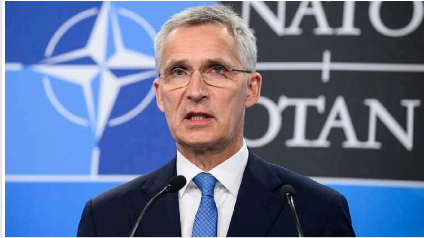
Столтенберг: "Україна приєднається до НАТО. Це питання не "якщо", а "коли"

Наразі українські воїни демонструють неабияку мужність і стійкість у боротьбі з ворогом. Вторгнення Путіна в Україну наблизило членство країни в НАТО.