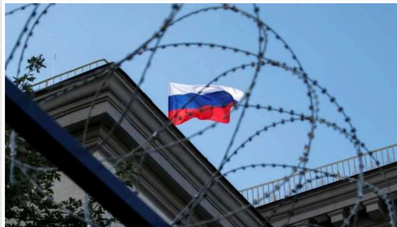
Bloomberg: Сполучені штати побоюються вводити нові серйозні санкції проти РФ, оскільки не хочуть розхитати світову економіку

Видання звернуло увагу на те, що в останній великий перелік санкцій не потрапили металургійний, енергетичний, банківський сектори.