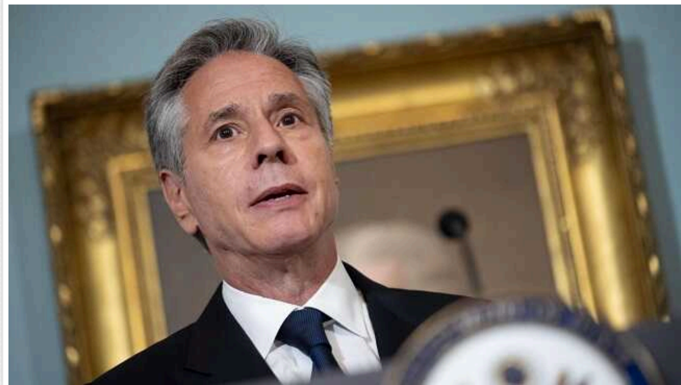
Держсекретар США Блінкен просить своїх підлеглих не використовувати «гендерну мову»