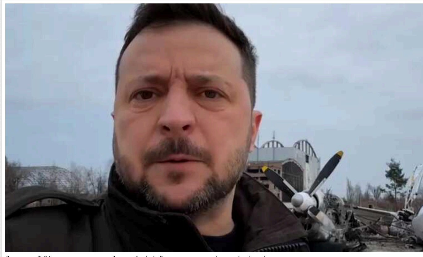
Зеленський 24 лютого звернувся до українців із Гостомелю на тлі уламків літаків

Президент записав відеозвернення з нагоди другої річниці широкомасштабного вторгнення РФ.