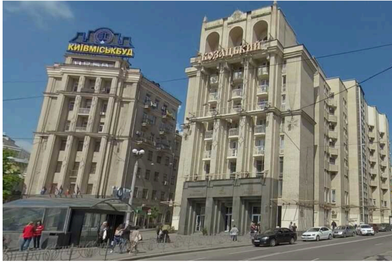
ФДМУ виставить на приватизацію готель «Козацький»

Кабмін забрав у Міністерства оборони і передав в управління Фонду держмайна для приватизації тризірковий готель "Козацький", який знаходиться в центрі Києва на Майдані Незалежності.