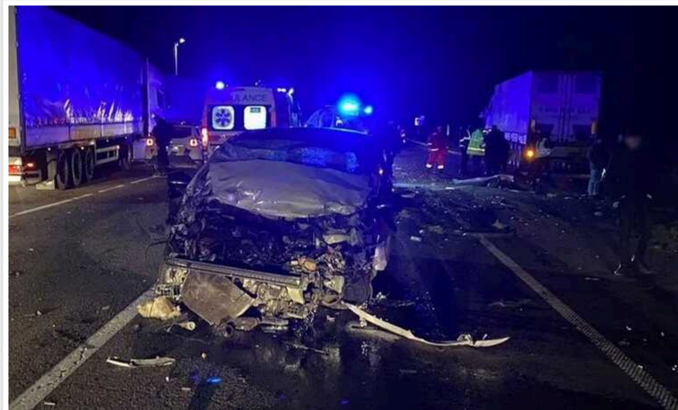
На Львівщині водій автобуса без прав вчинив смертельну ДТП з двома загиблими

У п'ятницю ввечері, 23 лютого, на трасі Київ – Чоп поблизу села Старий Яричів на Львівщині водій автобуса БА3, якого раніше позбавили водійських прав, спричинив смертельну ДТП, в якій загинули дві пасажирки.