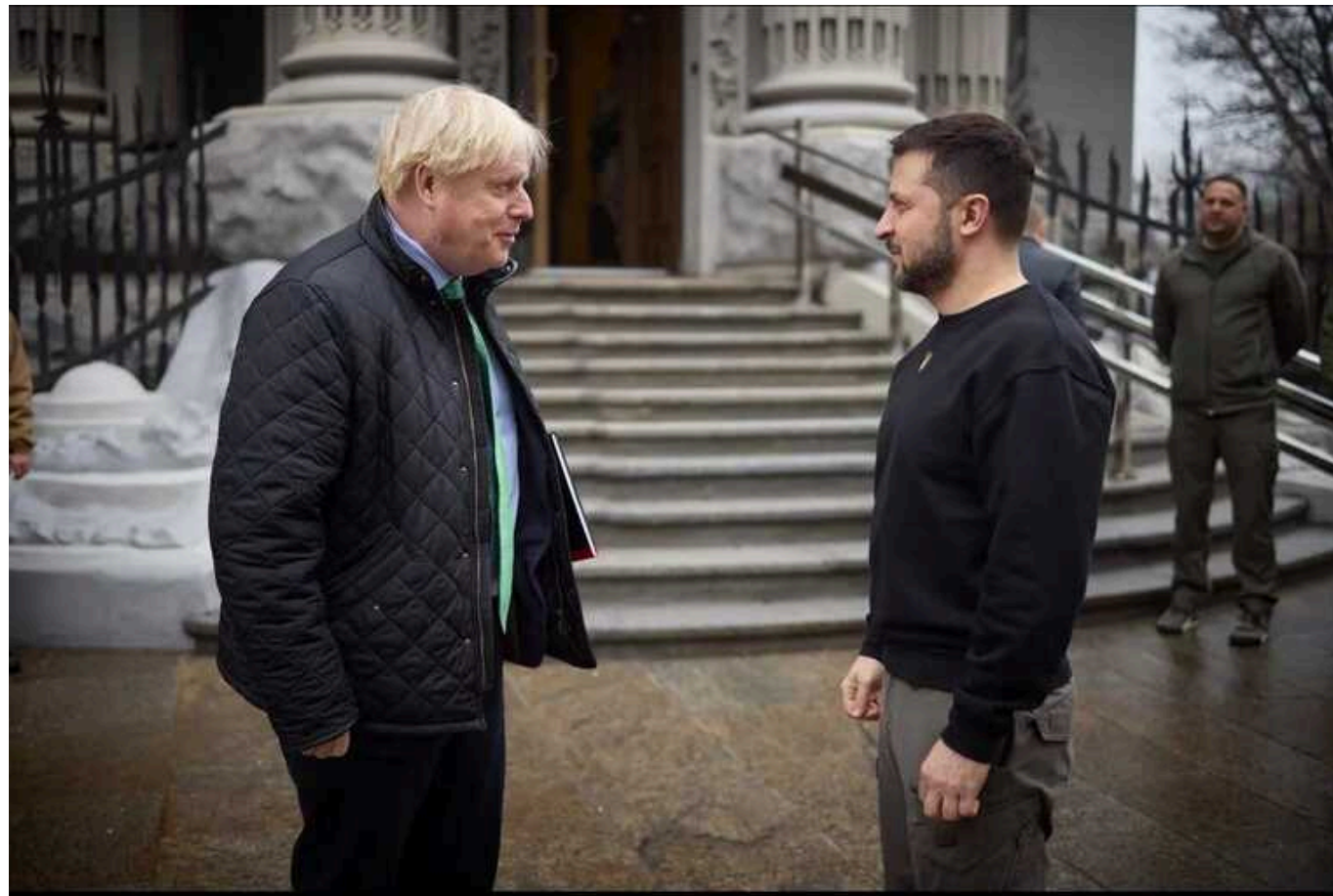
Борис Джонсон про візит до України: «Для мене велика честь бути тут»

Колішній прем'єр-міністр Великої Британії Борис Джонсон приїхав до України у другу річницю повномасштабного вторгнення Росії. Він висловив впевненість, що наша країна переможе і вижене путінську армію.