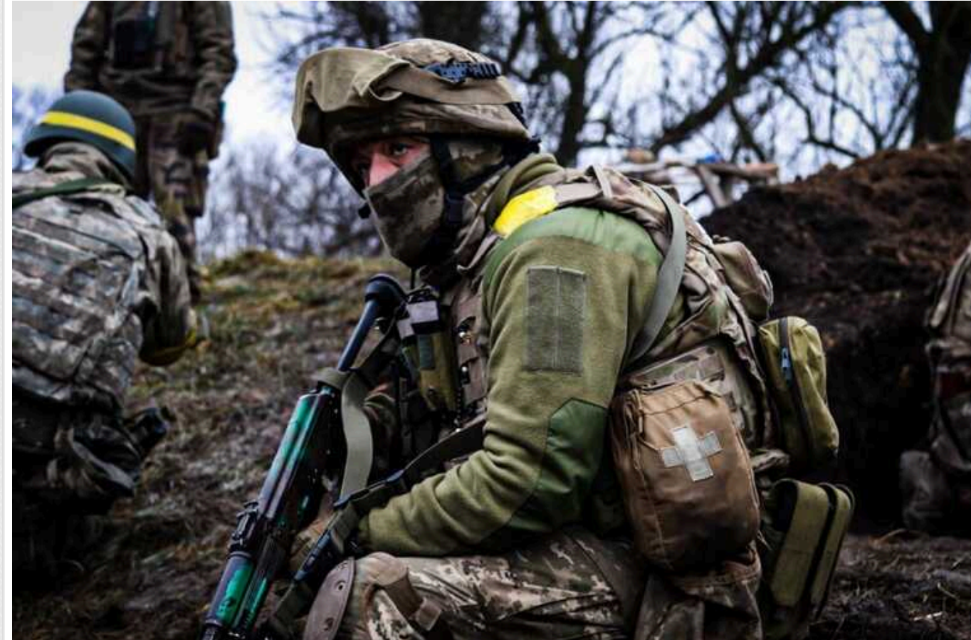
ЗСУ про пекельну стадію оборонної операції: виснажливі бої та висадка десанту

Російські загарбники застосовують усі види зброї, які тільки можливі, на двох найгарячіших точках фронту.