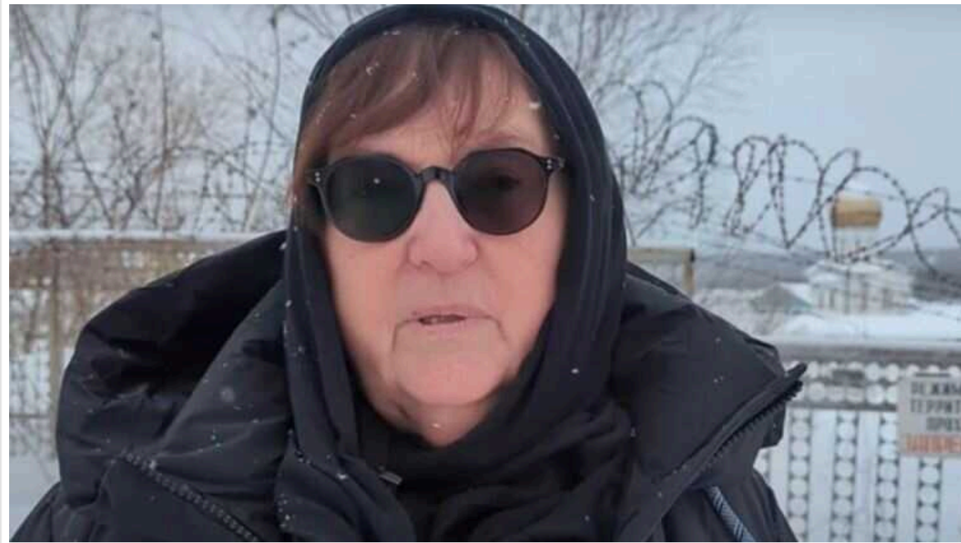
Матері Навального висунули ультиматум щодо похорону сина

Слідчий сказав матері Навального, що, або вона через 3 години погоджується на таємні похорони без публічного прощання, або її сина поховать у колонії.