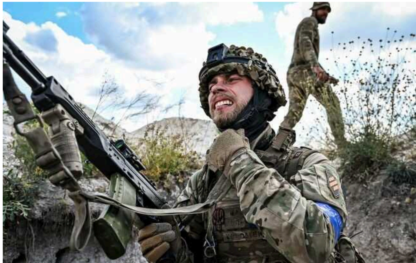
ЗСУ відбили частину позицій під Авдіївкою