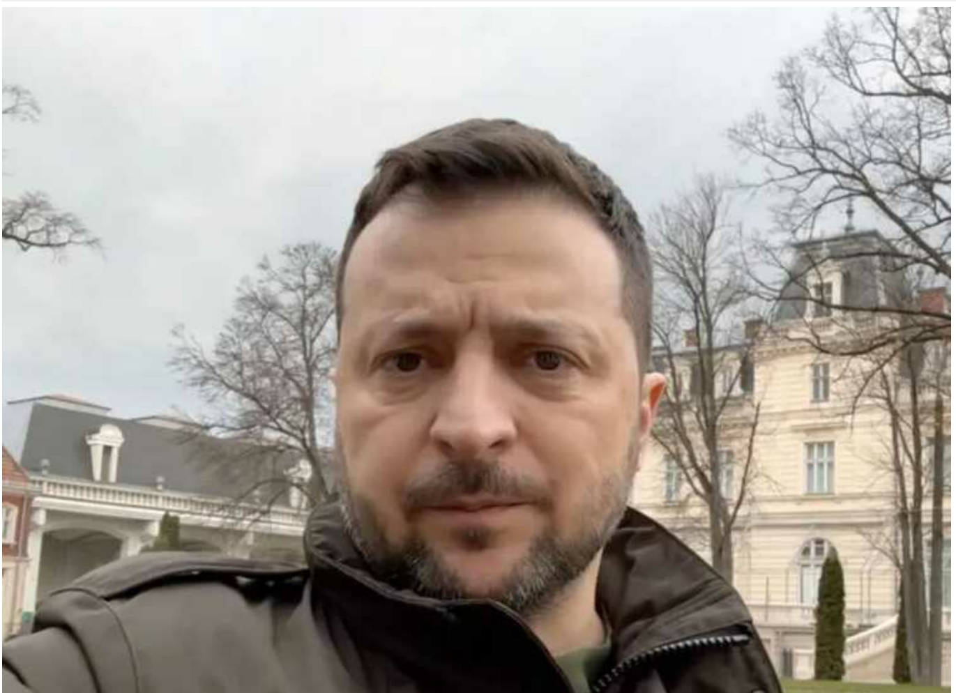
Зеленський пообіцяв посилити воїнів ЗСУ, захист українських міст і позиції держави: "Будуть нові домовленості"

Президент України Володимир Зеленський провів робочий день у п'ятницю, 23 лютого, у Львові. Глава держави мав зустріч із прем'єр-міністеркою Данії Метте Фредеріксен, а також з американськими сенаторами на чолі з Чаком Шумером.