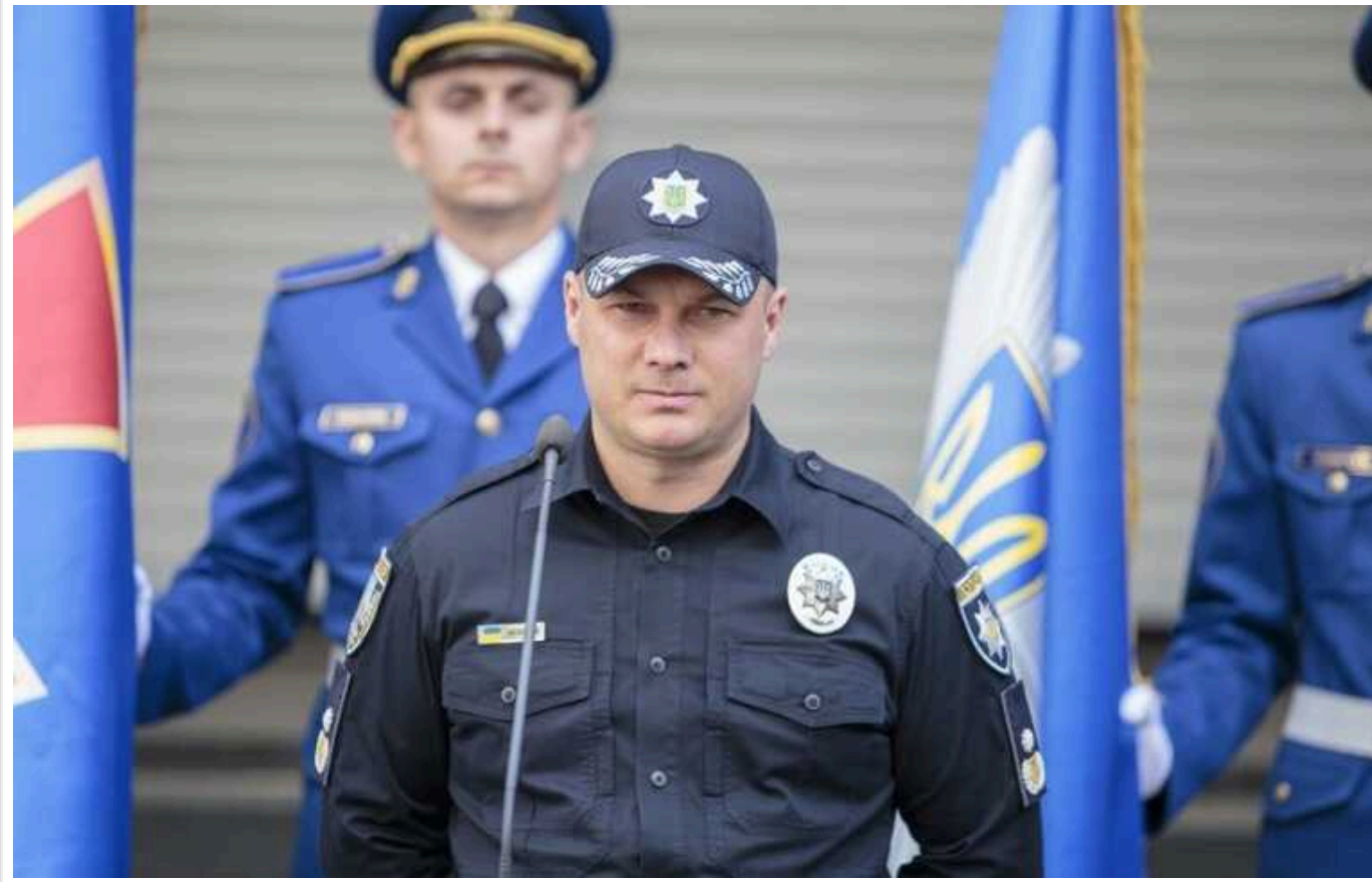
В Україні мають намір посилити мобілізацію поліцейськими, - Вигівський

Керівник Нацполіції Іван Вигівський повідомляє, що в Україні хочуть посилити мобілізацію поліцейськими.