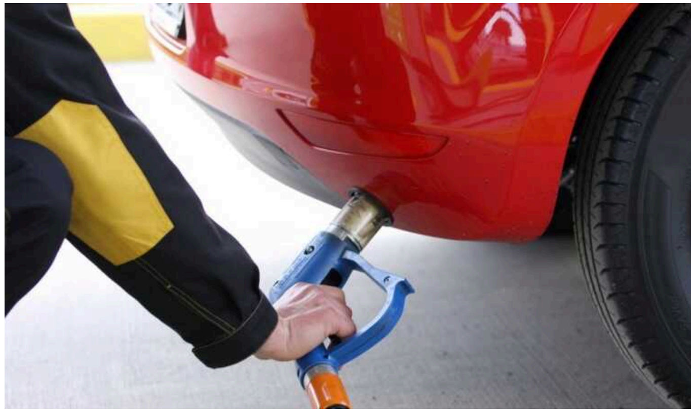
В Україні на АЗС стрімко змінили ціни на автогаз

В Україні відчутно здорожчав автогаз. За минулий тиждень (з 16 по 23 лютого) АЗС підвищили його вартість на 85 коп./л до середніх 27,59 грн/л. Ба більше, очікується, що зростання цін продовжиться – за прогнозами, автогаз українцям продаватимуть по 30 грн/л.