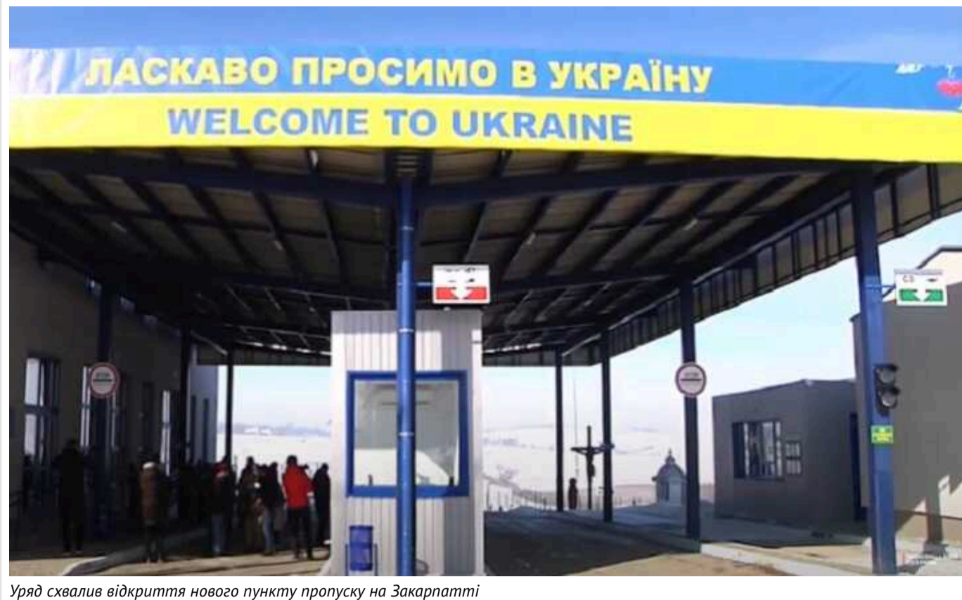
Уряд схвалив відкриття нового пункту пропуску на Закарпатті

«Велика Паладь – Надьгодош» працюватиме для легкових автомобілів.