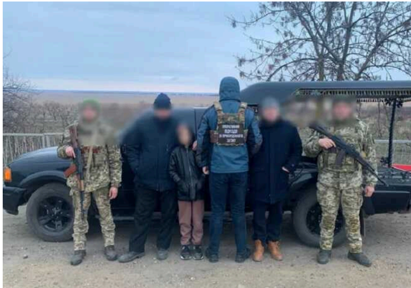
Священник УПЦ МП заховав у катафалк 10-річного хлопчика, щоб вивезти ухлянта у Молдову

Українські прикордонники затримали на кордоні священника УПЦ МП, який намагався перевезти чоловіка призовного віку до Молдови. Щоб приховати, що він везе більше осіб, ніж заявлено у документах, клірик заховав у катафалку 10-річного хлопчика, який їхав із ним, повідомили у п'ятницю, 23 лютого, у пресслужбі ДПСУ.