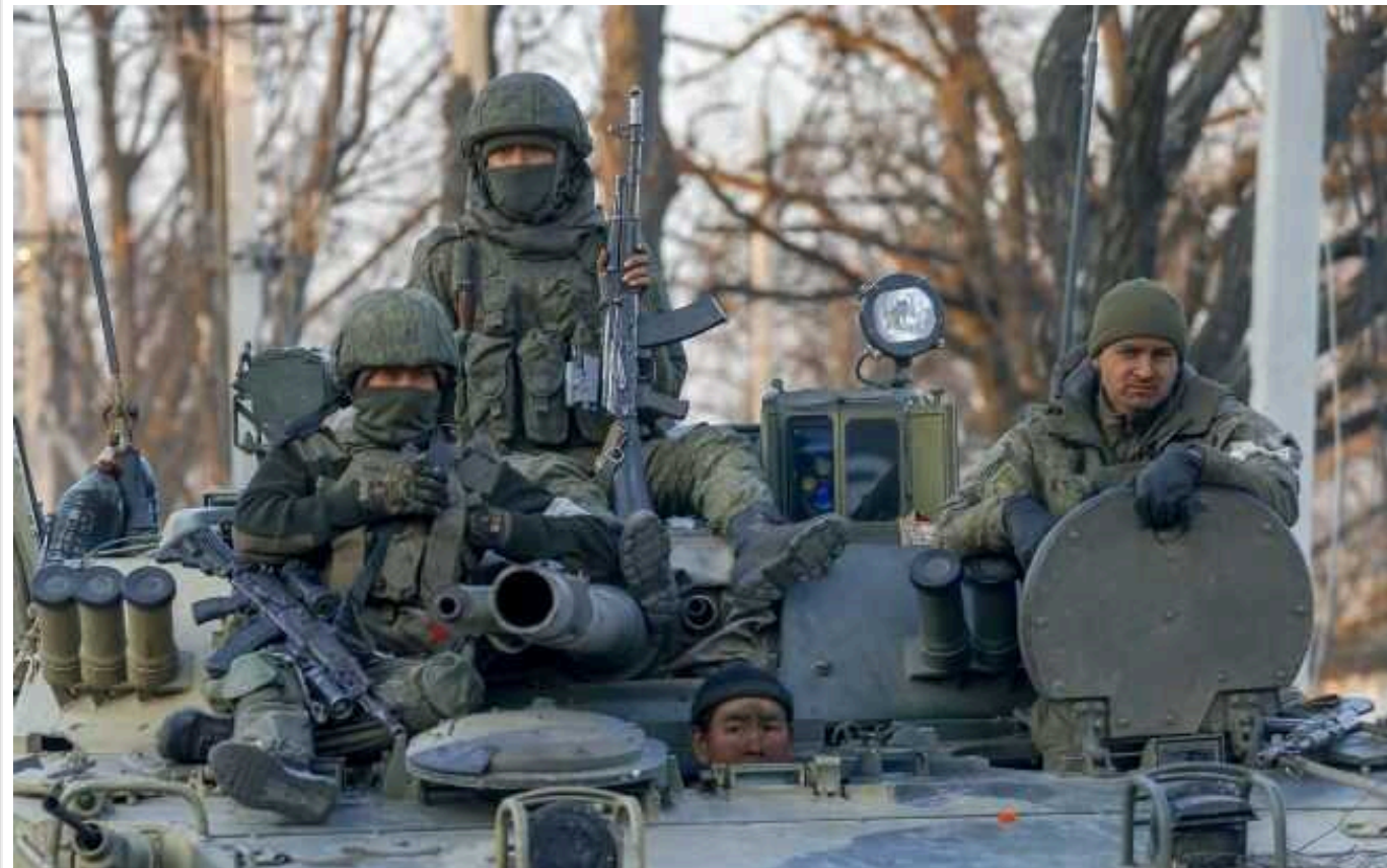
ЗС РФ домагалися прориву на Донеччині до свого свята: "Виснажливі бої за кожний будинок"