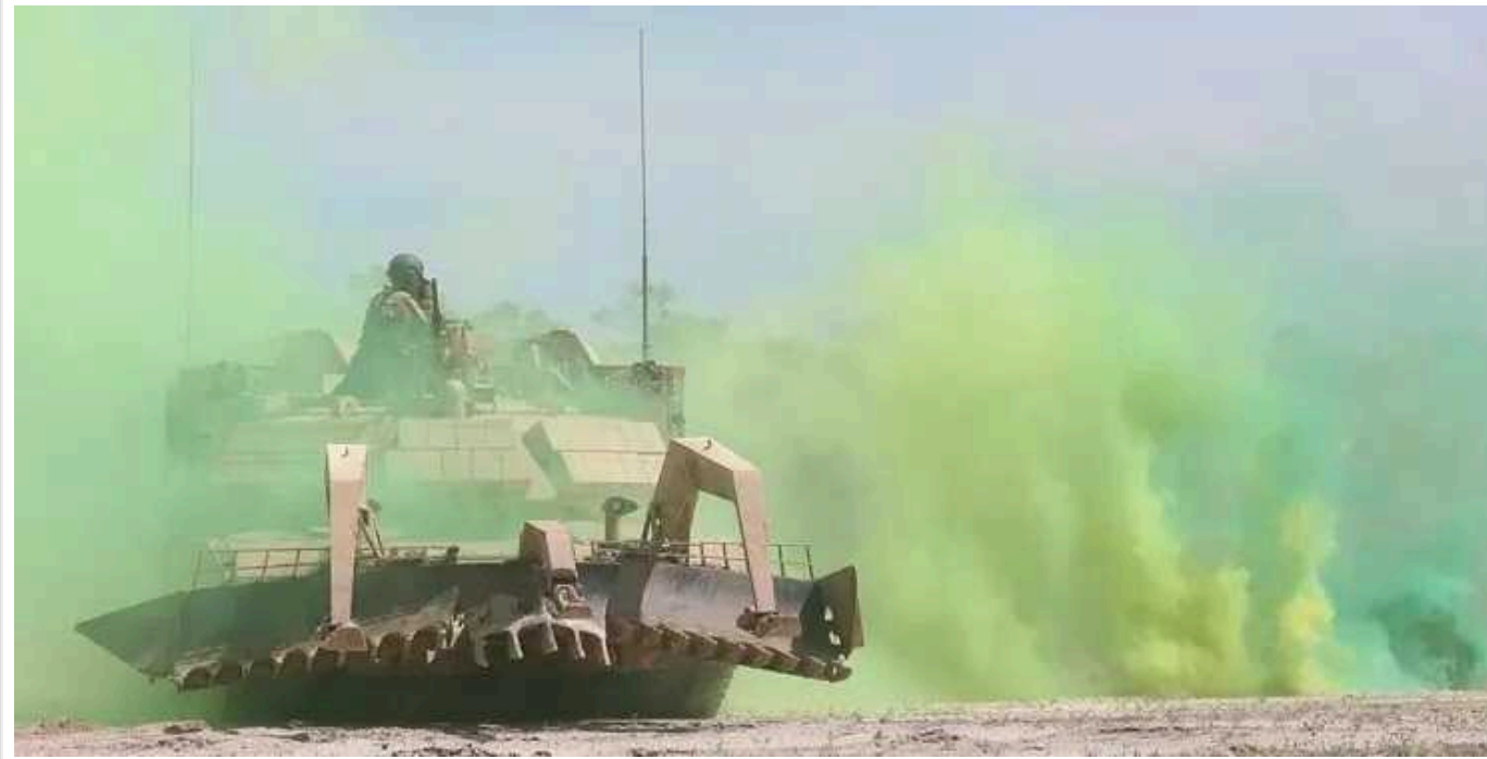
Під Авдіївкою ЗСУ втратили штурмову машину M1150 Assault Breacher, — Forbes

Це перша підтверджена втрата такої штурмової машини 47-го ОМБр. Наприкінці минулого року США негласно передали Україні як мінімум одну, а можливо, цілих шість штурмових M1150.