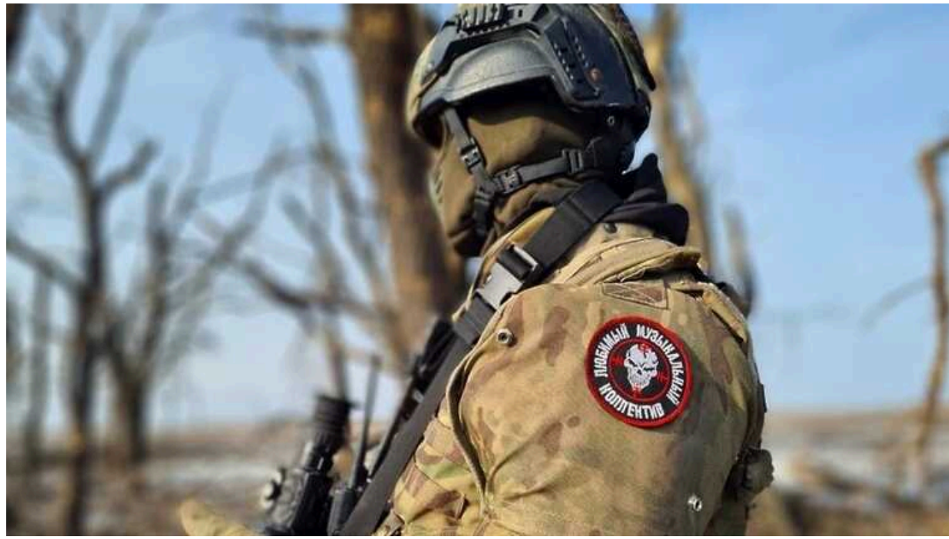
Гур: РФ формує добровольчий корпус із найманцями з ПВК "Вагнер"