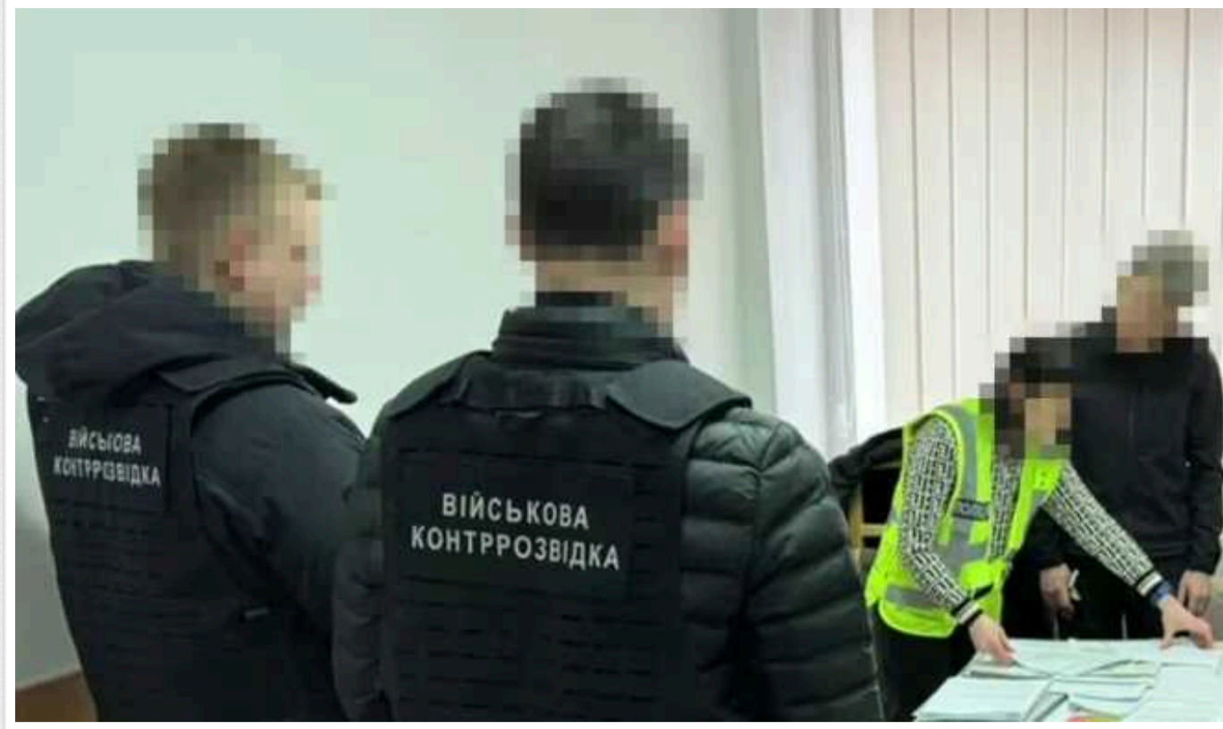
Через корупцію затримали посадовця управління Міноборони

Правоохоронці викрили на корупції чиновника Міноборони, який у 2022-2023 роках купив і "переписав" на цивільну дружину нерухомість та елітний автопарк на 14 млн грн.