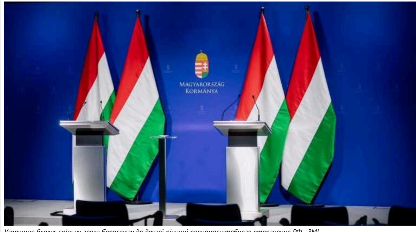
Угорщина блокує спільну заяву Євросоюзу до другої річниці повномасштабного вторгнення РФ - ЗМІ

Угорщина блокує спільну заяву Європейського союзу з нагоди другої річниці повномасштабного вторгнення й агресивної війни РФ проти України.