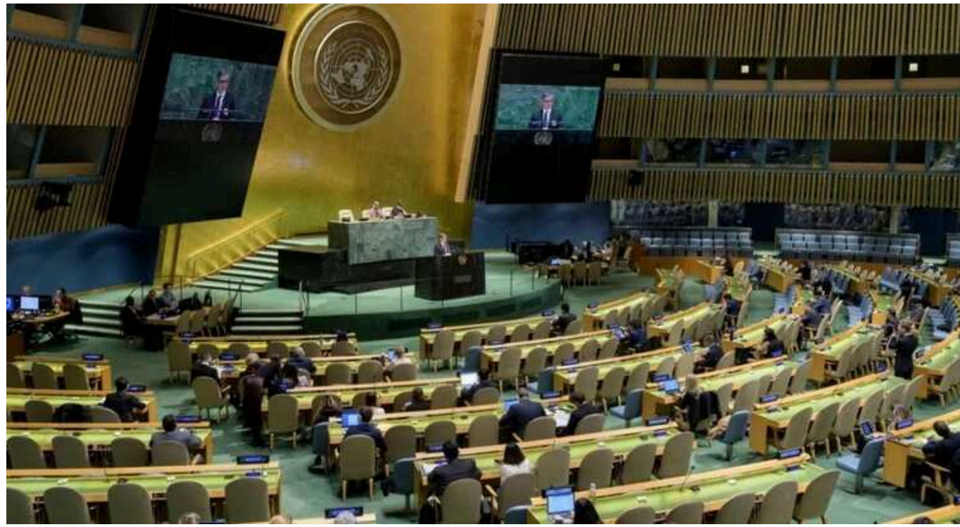
Генасамблея ООН збиралася до других роковин вторгнення РФ в Україну

У п'ятницю, 23 лютого, Генеральна асамблея ООН проводить засідання з питання "Ситуація на тимчасово окупованих територіях України". У засіданні беруть участь представники 64 держав.