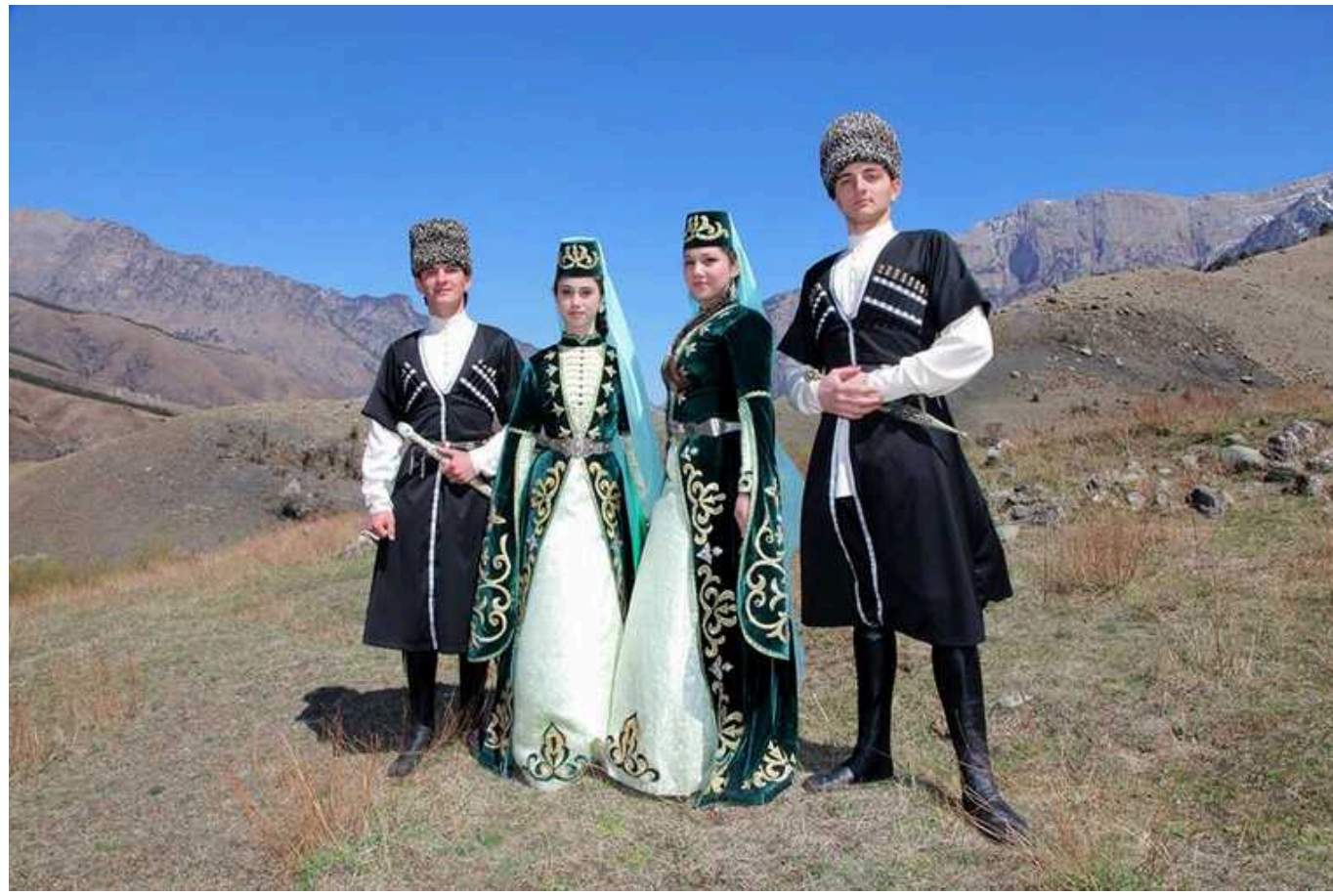
ВР прийняла ухвалу про право Інгушетії стати окремою від РФ державою

Олексій Гончаренко повідомив, що Верховна Рада голосами 248 народних обранців ухвалила постанову №10344 про право Інгушетії стати окремою державою. Нині це республіка у складі РФ.