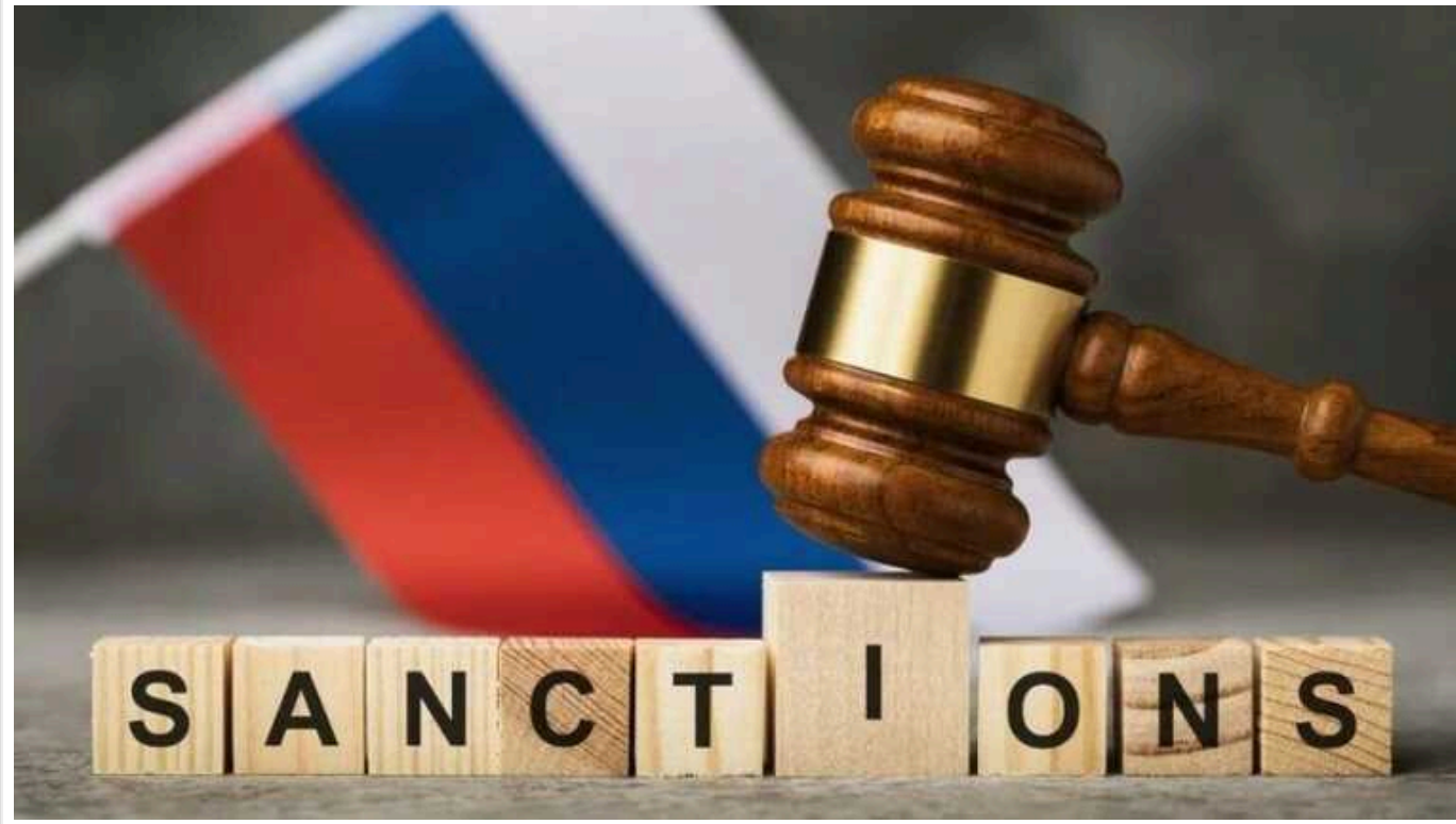
Попри санкції РФ заробила мільярд євро від купівлі палива Євросоюзом

Попри масштабні санкції на російську нафту, ЄС минулого року повповнив військову скарбницю Росії на 1 мільярд євро шляхом закупівель палива.