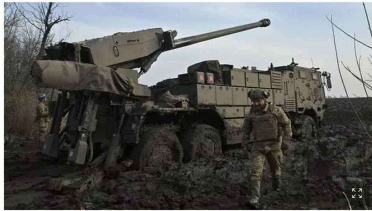
Des militaires ukrainiens prêts d'un canon autotracté Caesar de 155 mm, sur une ligne de front, dans le sud de l'Ukraine, le 14 février.

Publié hier à 19:30, mis à jour il y a 11 minutes