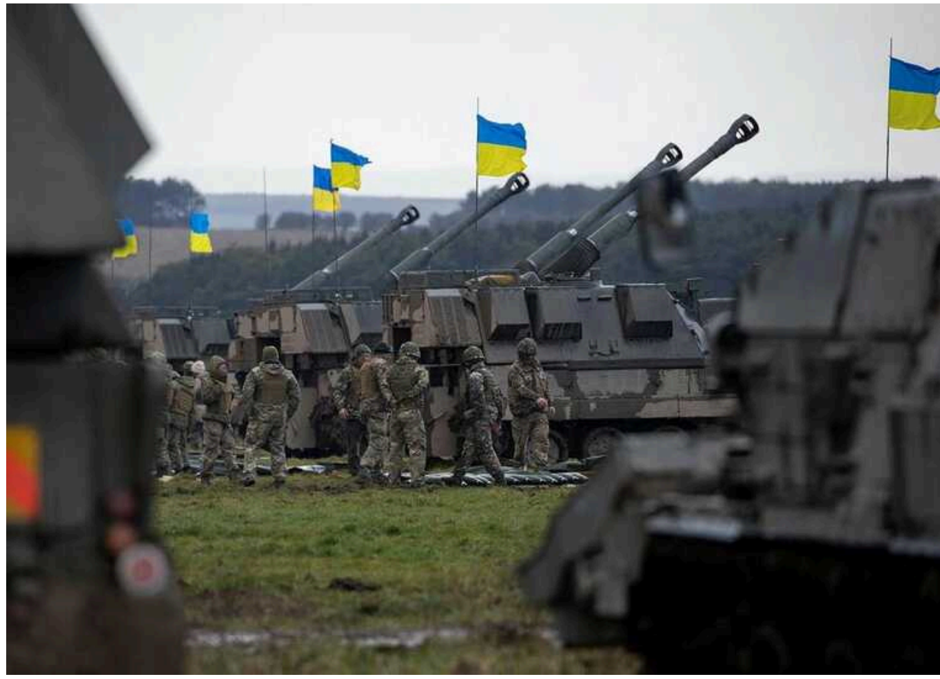
Le Figaro: На українському фронті деякі елементи "екологічної" західної техніки поїли миші

Видання Le Figaro повідомляє, що окремі елементи "екологічної" західної техніки на українському фронті поїли миші.