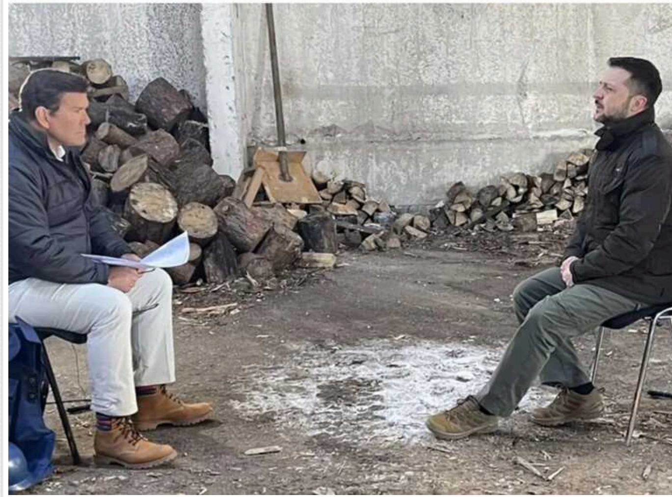
Зеленський оцінив можливість зміни влади у Росії і висловився щодо заяв Трампа: "Це довгий і важкий шлях"

Народ держави-терориста Росії здатний здійснити зміну у своїй країні й усунути диктатора Володимира Путіна. Однак це буде "довгий і важкий шлях".