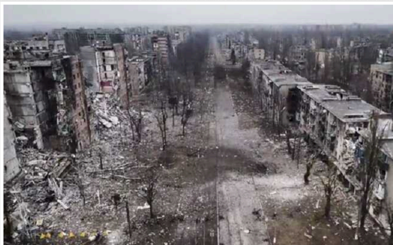
Український прикордонник розповів про останню операцію в Авдіївці: "Вийшли без втрат"

Український прикордонник, який командував однією з груп воїнів, що виходили з Авдіївки, розповів про вихід з міста. Захисникам довелося йти під безперервними обстрілами, які загарбники вели з усього, з чого могли.