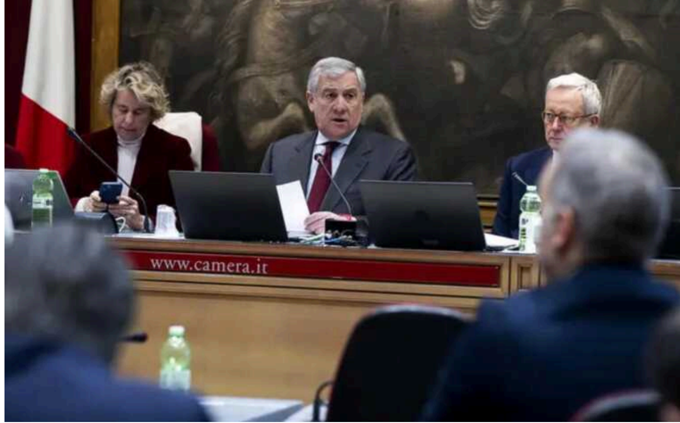
В угодах про безпеку немає гарантій військової підтримки, - глава МЗС Італії

Майбутня угода щодо безпеки між Італією та Україною “не матиме обов’язкової юридичної сили”.