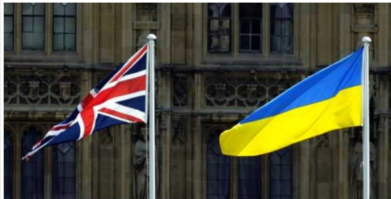
Велика Британія ввела нові санкції проти РФ

Міністр закордонних справ Великої Британії Девід Кемерон 22 лютого оголосив про запровадження понад 50 нових санкцій проти фізичних та юридичних осіб, які підтримують незаконну війну президента РФ Володимира Путіна в Україні.