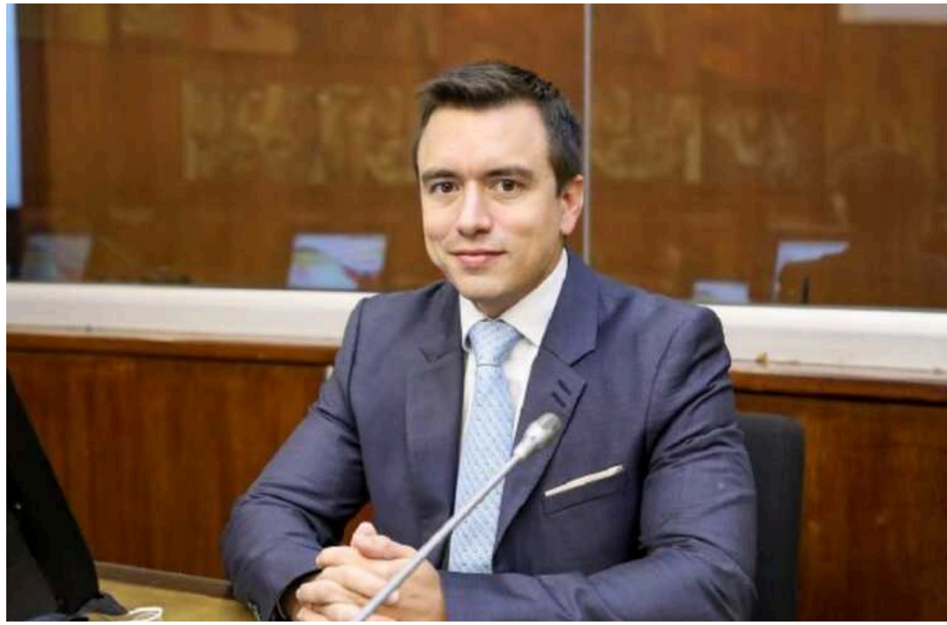
Президент Еквадору підтвердив відмову передавати Україні військову техніку

Президент Еквадору Даниель Нобоа підтвердив, що його країна не передаватиме військову техніку США, яку потім могли надати Україні.