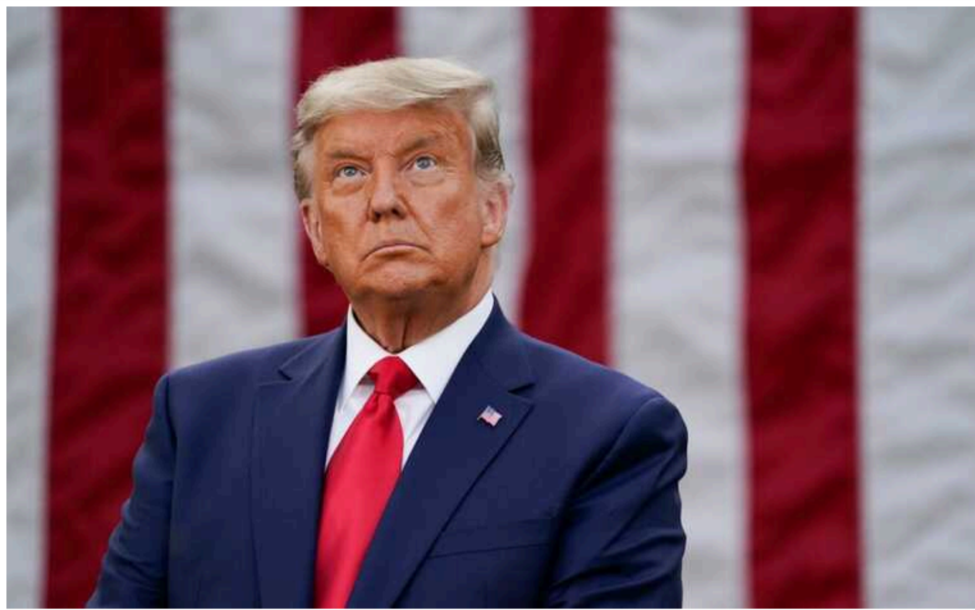
Зеленський запросив Трампа на передову

Президент України Володимир Зеленський прокоментував FOX News відому обіцянку кандидата у президенти США Дональда Трампа закінчити війну з Росією за 24 години, запросивши його на передову.