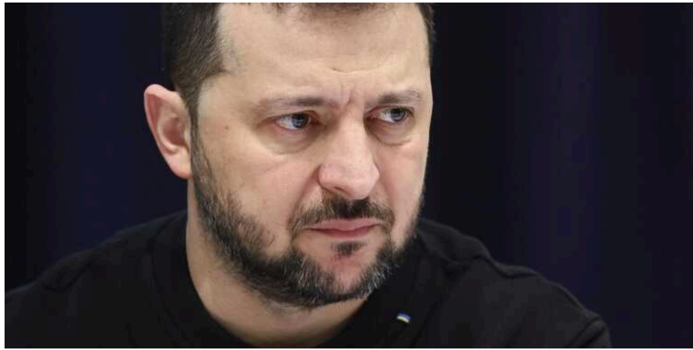
Зеленський, як і раніше, виступає проти перемир'я по нинішній лінії фронту

Незважаючи на важку військову ситуацію, Зеленський, як і раніше, виступає проти перемир'я по нинішній лінії фронту.