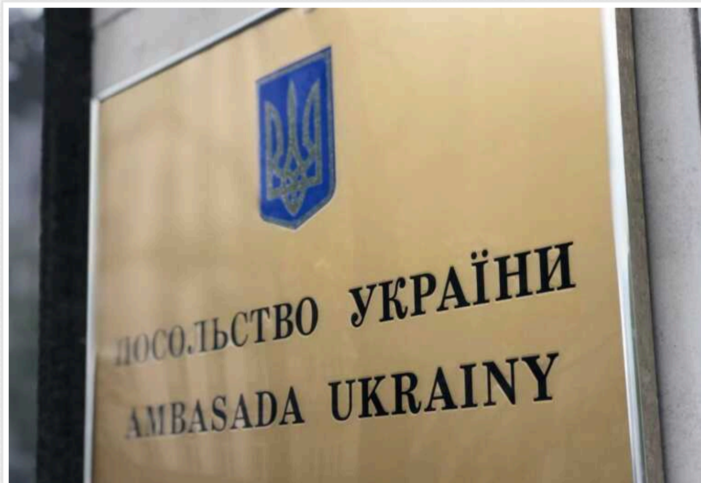
Посольство України у Польщі надіслало офіційну ноту до польських органів влади та вимагає знайти і притягнути винних до відповідальності

«Безкарність є неприйнятною. Злочинці, які зневажають і нищать чуже майно, повинні постати перед законом. Правова держава, якою є Польща, повинна діяти у таких випадках рішуче і безкомпромісно», - наголосив український посол Зварич.