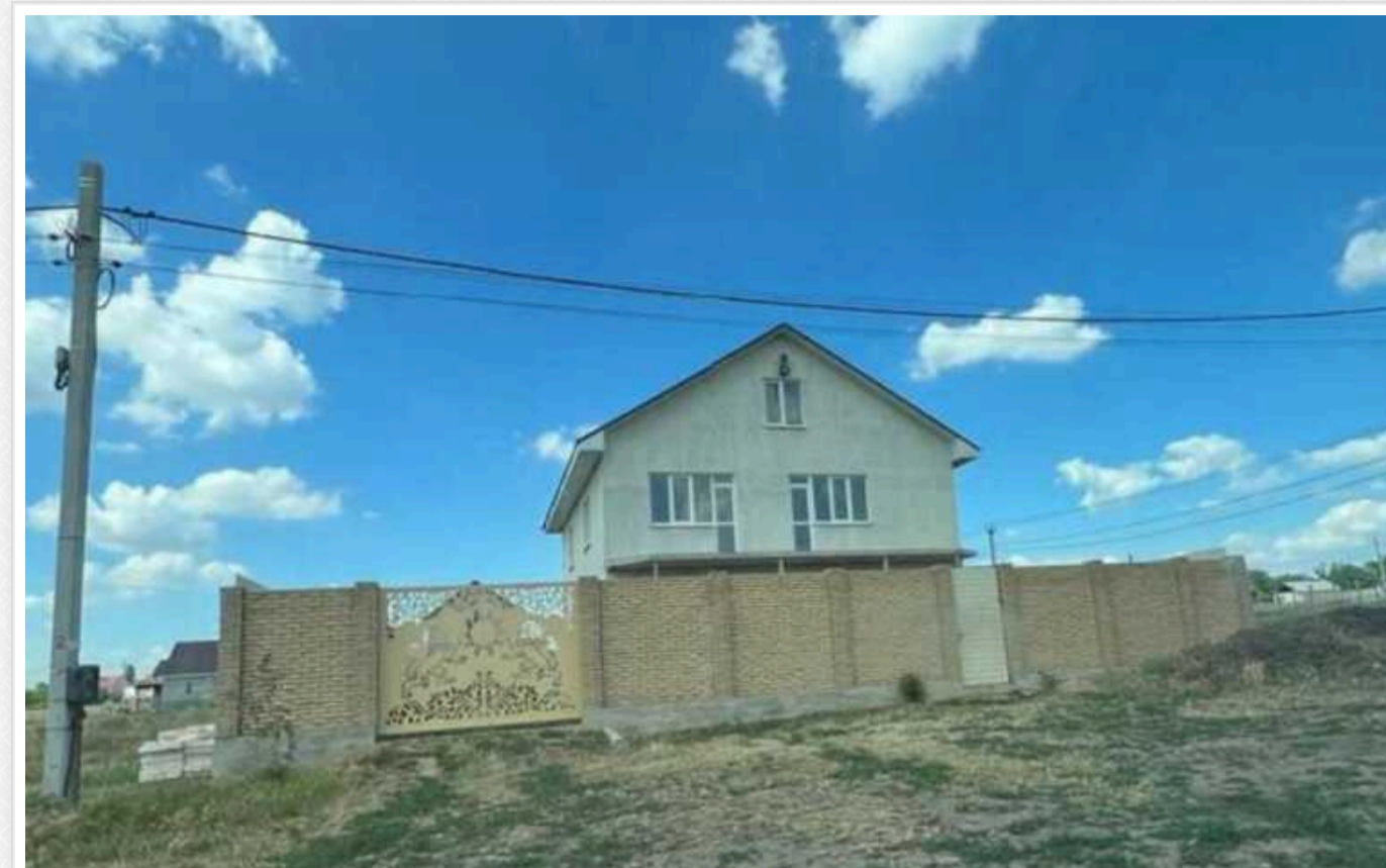
На Одещині судитимуть посадовця військової частини, якого ДБР викрило на використанні бійців для будівництва маєтку для тещі

Працівники ДБР завершили розслідування щодо заступника командира батальйону одної з військових частин Одещини.