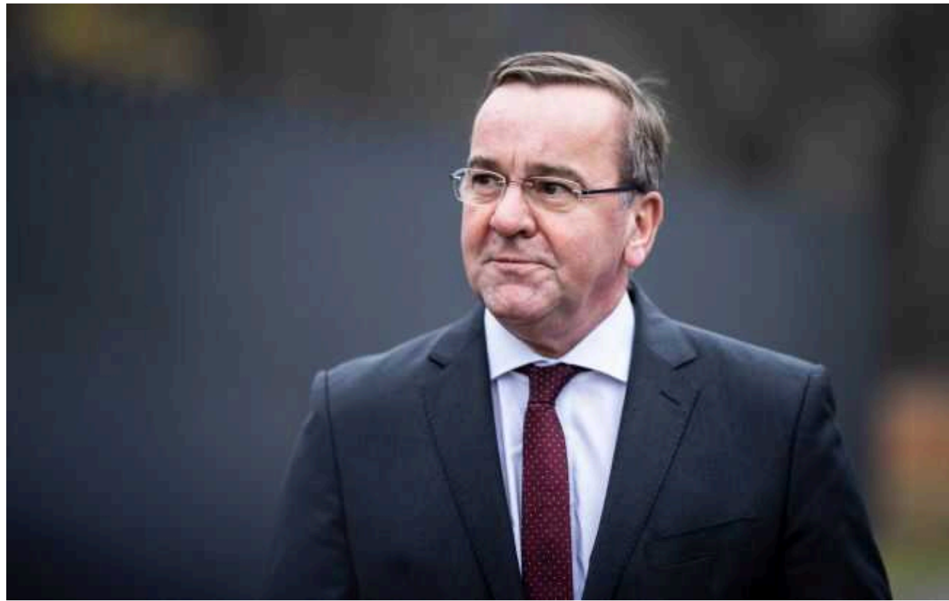
Міністр оборони Німеччини не знає, чи отримає Україна додаткові необхідні системи озброєння великої дальності

Міністр оборони Німеччини Пісторіус не зміг відповісти, чи має на увазі прийнята вчора Бундестагом рекомендація про передачу Україні ракет Taugus.