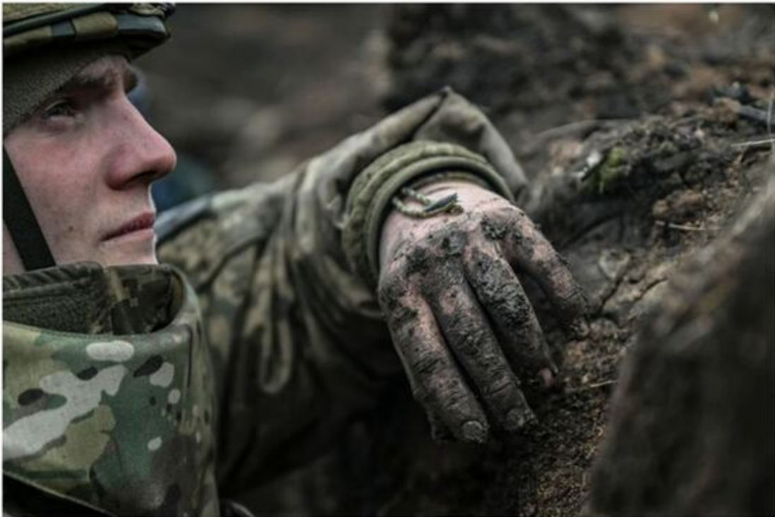
After many weeks of bloody fighting, Russia finally took the fortress city of Avdiivka this month

Free article usually reserved for subscribers