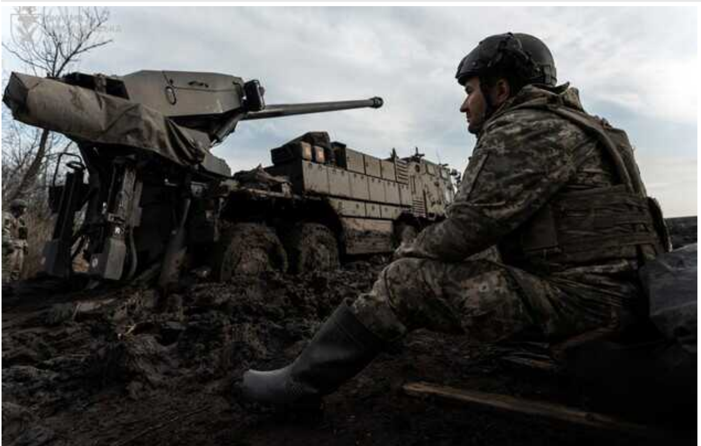
Військова стратегія України: вижити у 2024 році, щоб перемогти у 2025, - Politico

З таким заголовком вийшов матеріал у Politico. У ньому журналісти опитали аналітиків, діючих офіцерів і військових експертів щодо перспективи на наступний рік.