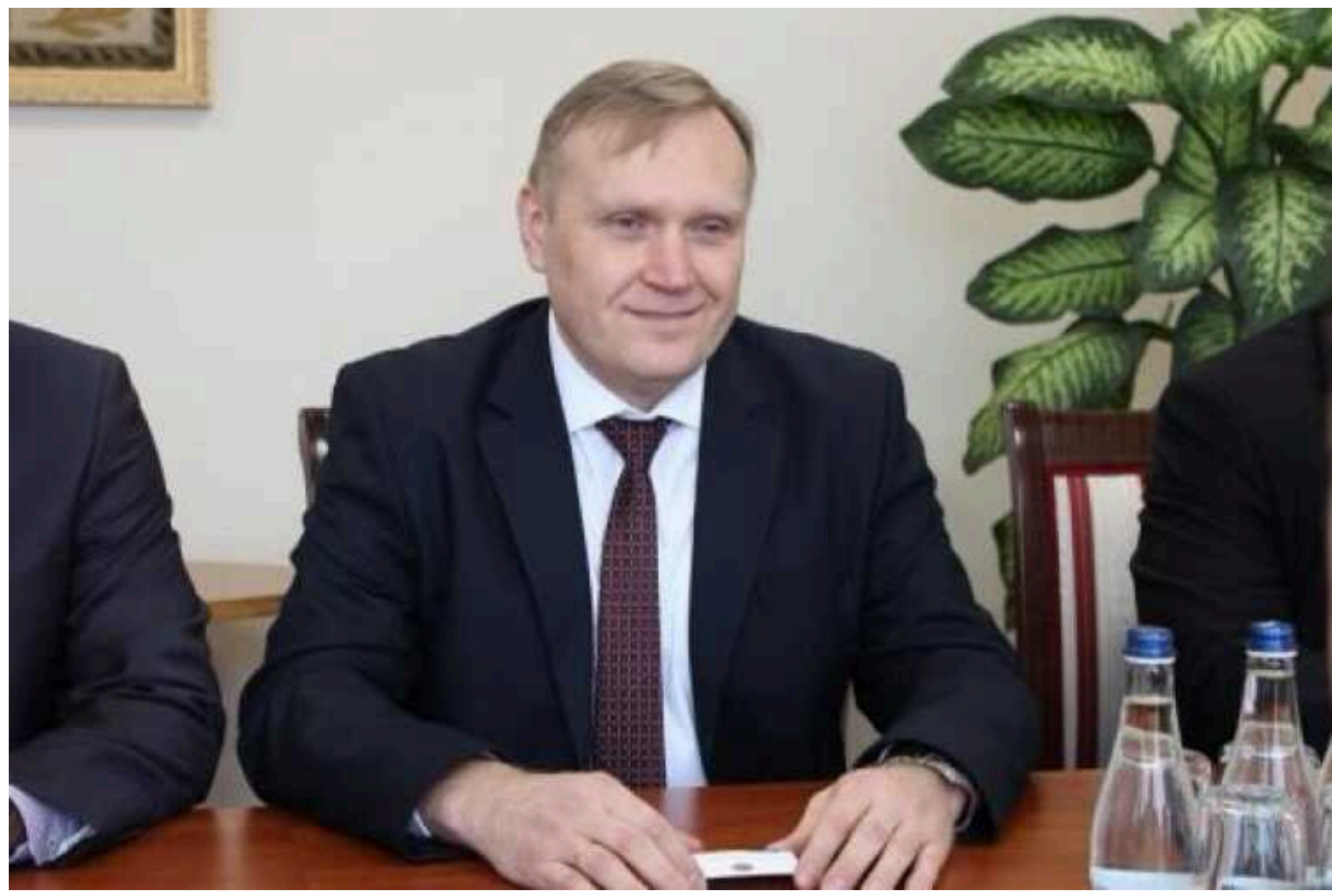
Посол України прокоментував наміри поновити консульські послуги у Придністров'ї

Посол України у Молдові Марко Шевченко пояснив, що можливе поновлення консульських послуг для українців у Придністров'ї пов'язане з великою потребою у цьому і цей процес, якщо розпочнеться, буде відбуватись згідно із законодавством Молдови.