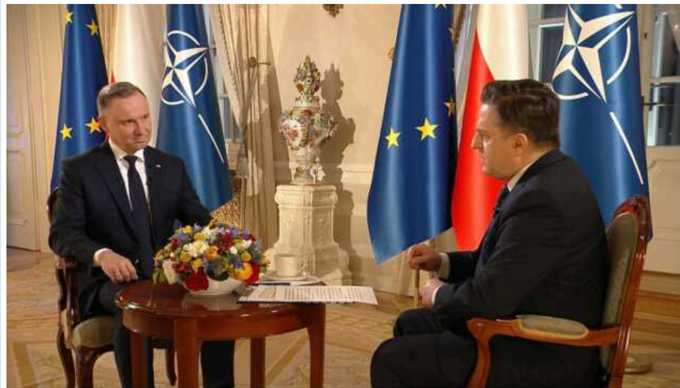
Президент Польщі Дуда звернеться до Зеленського з нагоди другої річниці російської агресії

Президент Польщі Анджей Дуда не планує відвідувати Україну у другу річницю російської агресії проти України. Утім, планується його звернення до президента Володимира Зеленського з нагоди цієї річниці.