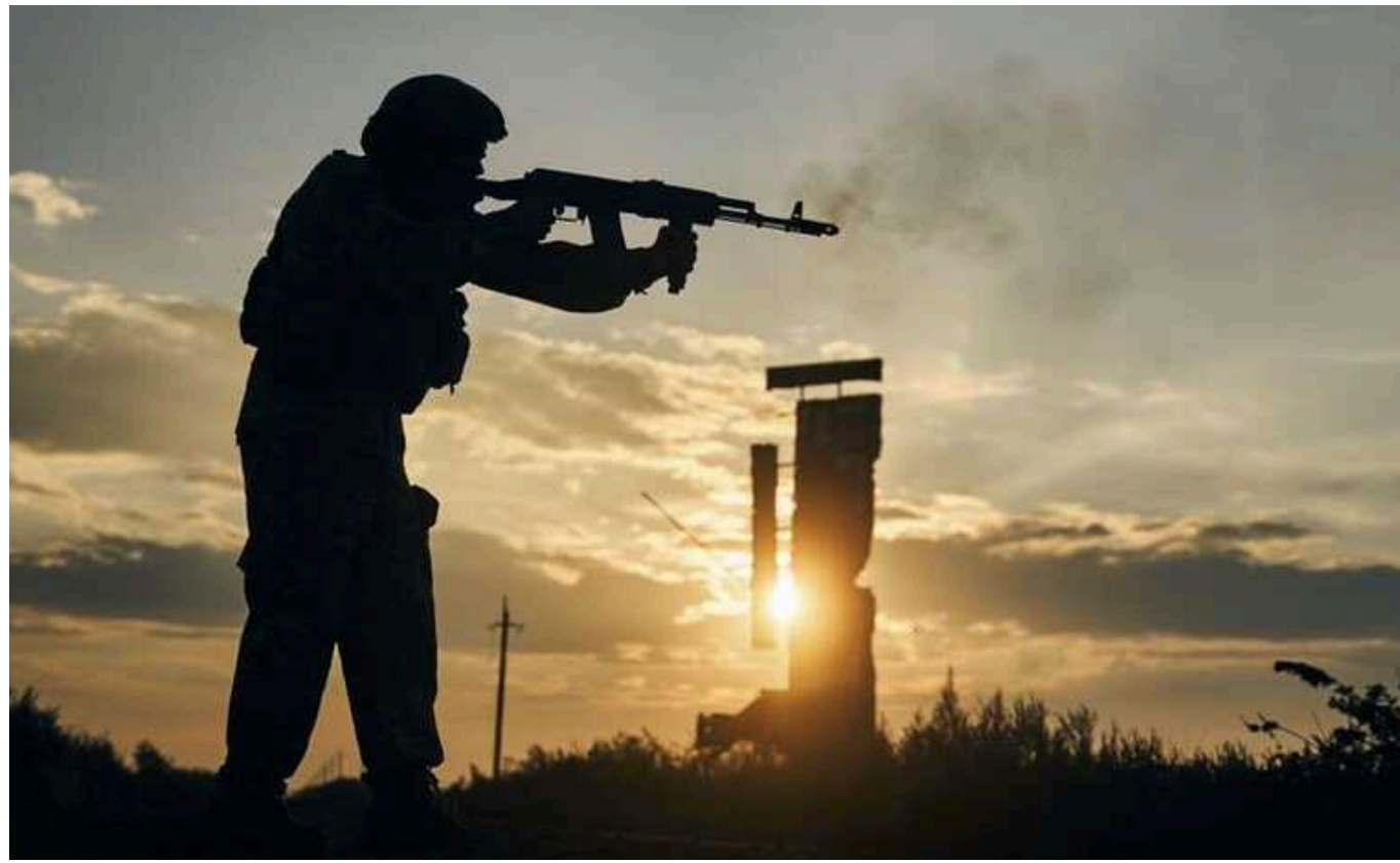
DeepState: Війська РФ просунулися в Іванівському, Северному й східніше Орлівки, ворога відкинута в Победі

Окупаційні війська Росії останнім часом просунулися на Бахмутському та Авдіївському напрямках. Натомість на Мар'їнському ЗСУ відкинули ворога від населеного пункту, про "захоплення" якого стверджували пропагандисти.