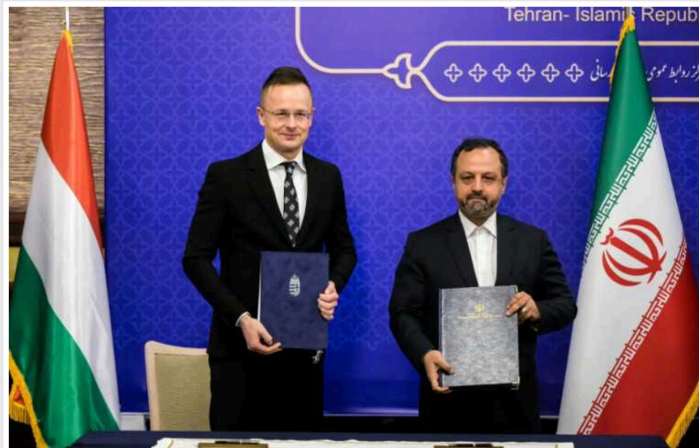
Голова МЗС Угорщини поїхав до Ірану і похвалився співпрацею з країною, що дає РФ зброю для вбивств українців

Міністр закордонних справ Угорщини Петер Сіярто похвалився своїм візитом до Ірану, де домовився про нові сфери співпраці між Будапештом та Тегераном.