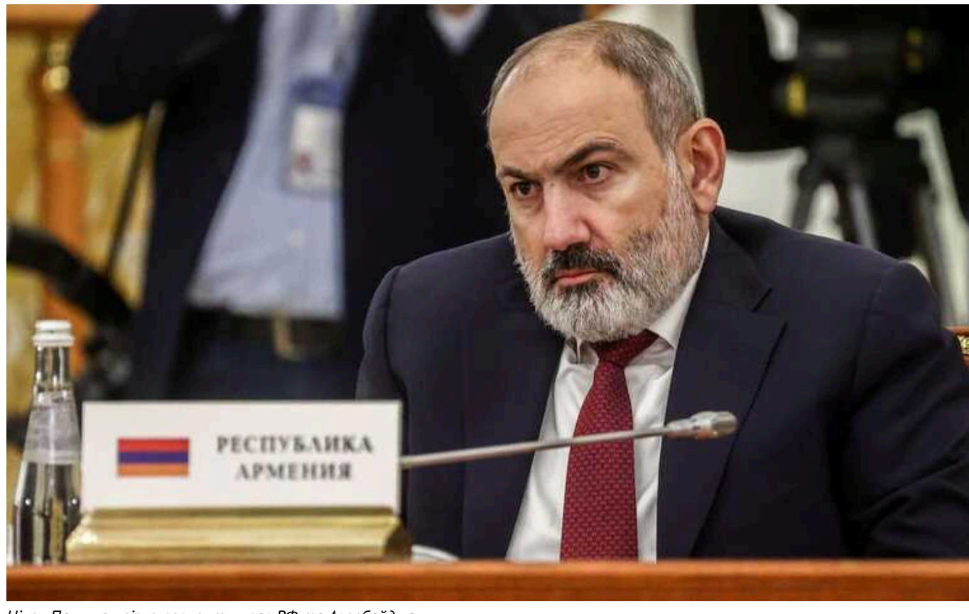
Нікол Пашинян різко розкритикував РФ та Азербайджан

Пашинян заявив, що участь Вірменії в ОДКБ – заморожена.