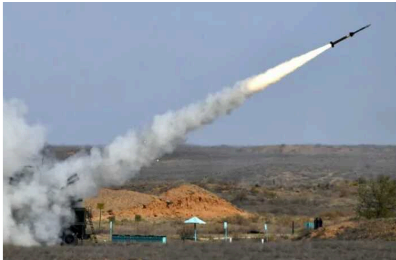
The Wall Street Journal: Чому найбільші санкції не зупинили «військову машину Кремля»

Західні санкції позбавили Росію близько 400 мільярдів євро доходу, який країна могла б отримати від початку лютого 2022 року, розповіли журналісти.