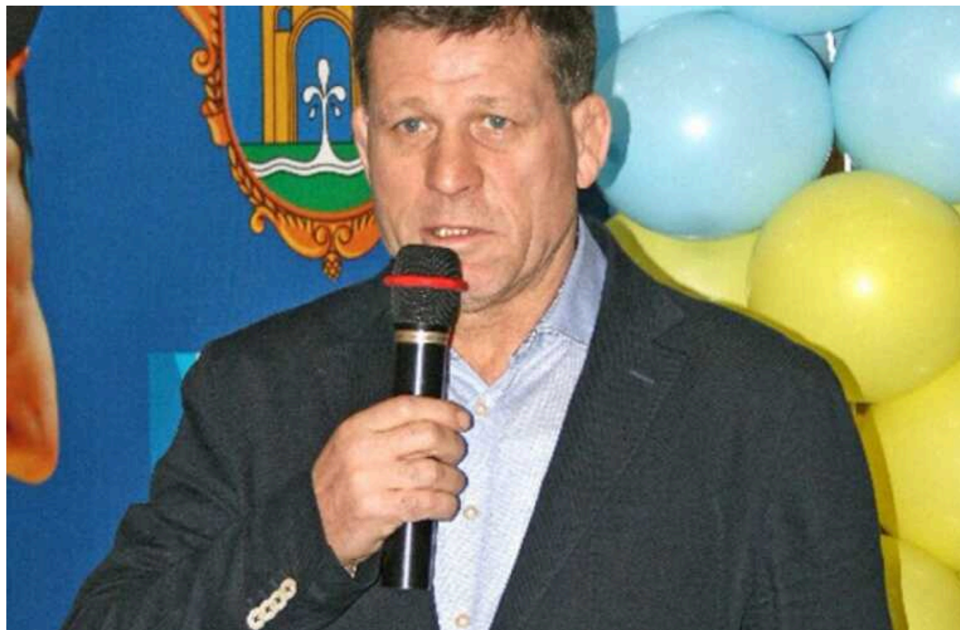
Гамівна сорочка для «бакинського» злочія: чому Олега Крапівіна не пускають в Україну?

Навколо Олега Крапівіна, відомого як кримінальний авторитет Олег "Бакинський", не вихуюють скандали. У спробі повернутися в Україну він намагався оскаржити рішення Міграційної служби України про скасування посвідки на проживання та заборону на в'їзд в Україну, подавши у грудні 2022 року позов до ДМС України. Однак навіть поді Окружний адміністративний суд залишив рішення Міграційної служби в силі.